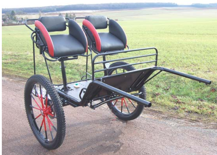
ENDURO TRAINING XL , avec 2 sièges meneur

SULKY ENDURO TRAINING: spécifiquement conçu pour l'endurance, il peut être utilisé pour l'entraînement des chevaux, le trec ou le marathon .