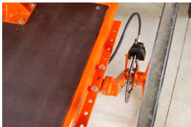
L'essieu s'avance ou se recule par rapport à l'axe de la caisse, afin d'obtenir un bon équilibrage du sulky