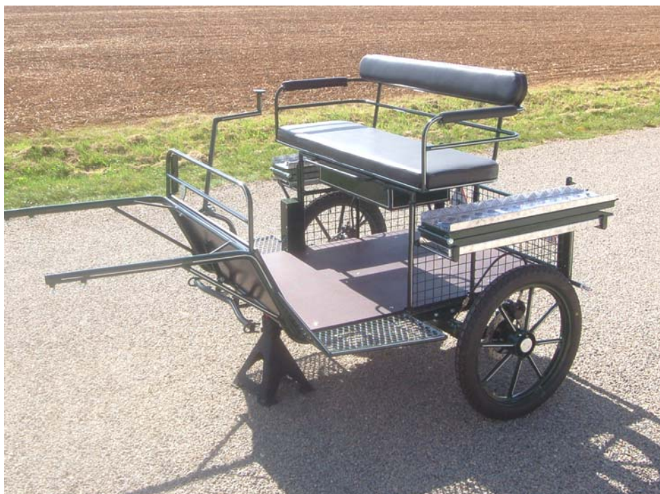
RANCHO HANDY équipée d'une banquette 2 places amovible, pour une utilisation classique