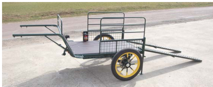
RANCHO HANDY équipée en plateau pouvant recevoir un fauteuil roulant

La RANCHO HANDY a été conçue en collaboration avec des centres spécialisés dans la gestion de personnes à mobilité réduite afin de faire partager les plaisirs de l'attelage aux personnes en fauteuil roulant, lequel accède au plateau de la voiture à l'aide de 2 rampes. L'accompagnateur marche à côté de l'âne ou du poney et dirige l'attelage, la RANCHO HANDY est également équipée d'une banquette amovible.