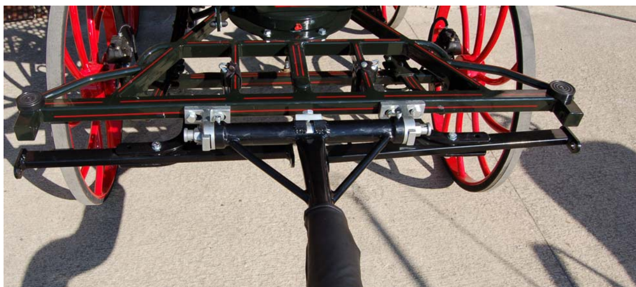
Possibilité d'une limonnière à la place des brancards individuels